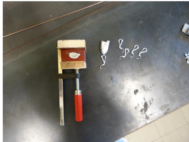
Výroba formy, zhotovení odlitků, patinování - pokovení