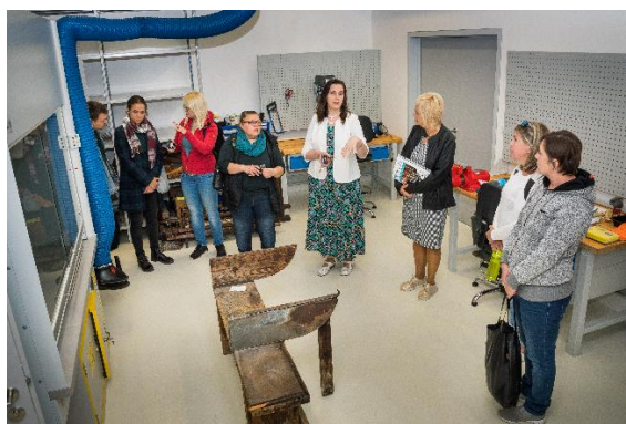
Prohlídka nové depozitární budovy – depozitářů, příjmového pracoviště,