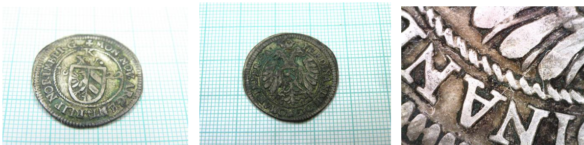
Stav před konzervováním