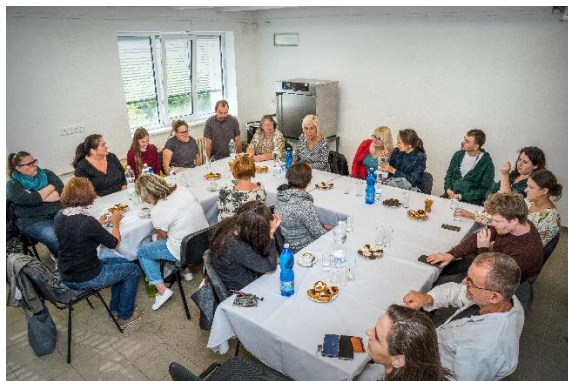
prohlídka digitalizačního pracoviště.