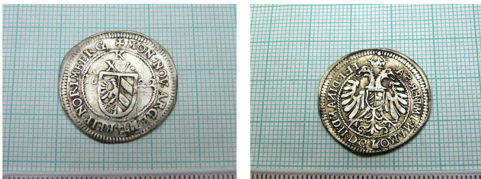
Stav po konzervování